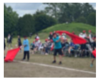
運動会を大いに盛り上げた応援団と応援合戦