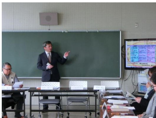
学校長による学校運営の基本方針の説明