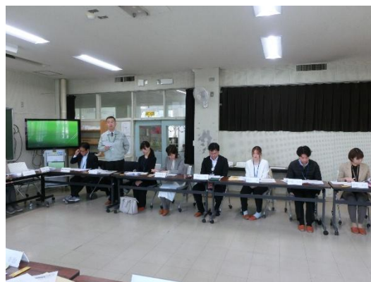
恵庭市教育委員会による説明