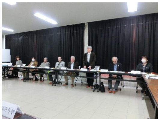
町内会長による熟議