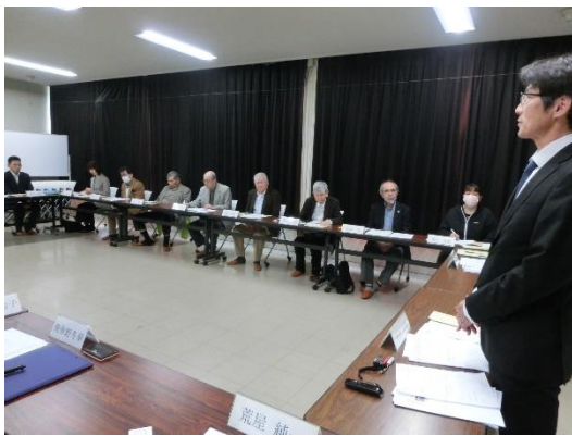
学校長による学校運営の基本方針の説明