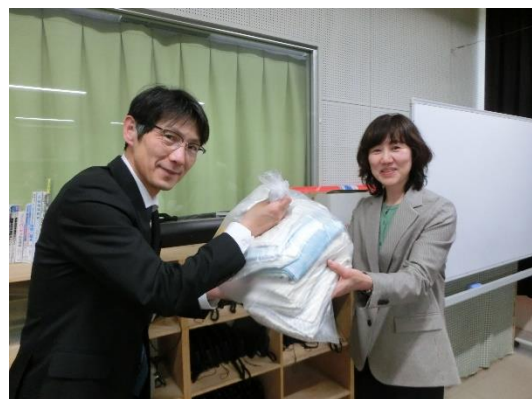
大安寺婦人会の皆様から雑巾の寄贈