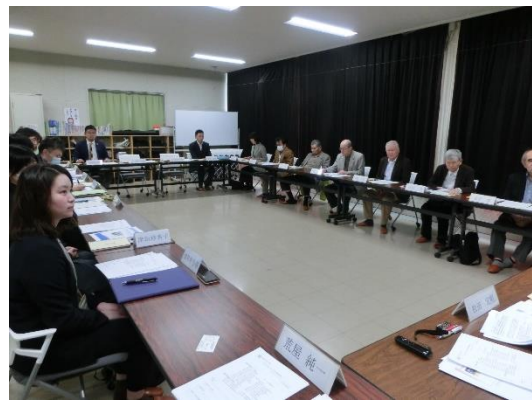
恵庭市教育委員会による説明