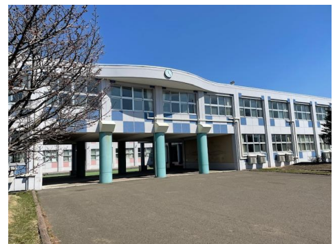
<春を迎えた恵み野旭小学校>