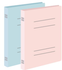
さんすう・こくご のふあいる