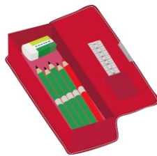
ふでばこ・えんぴつ・けしごむ