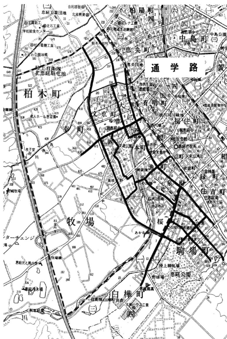
----- 自転車通学の境界線 ————— 通学路